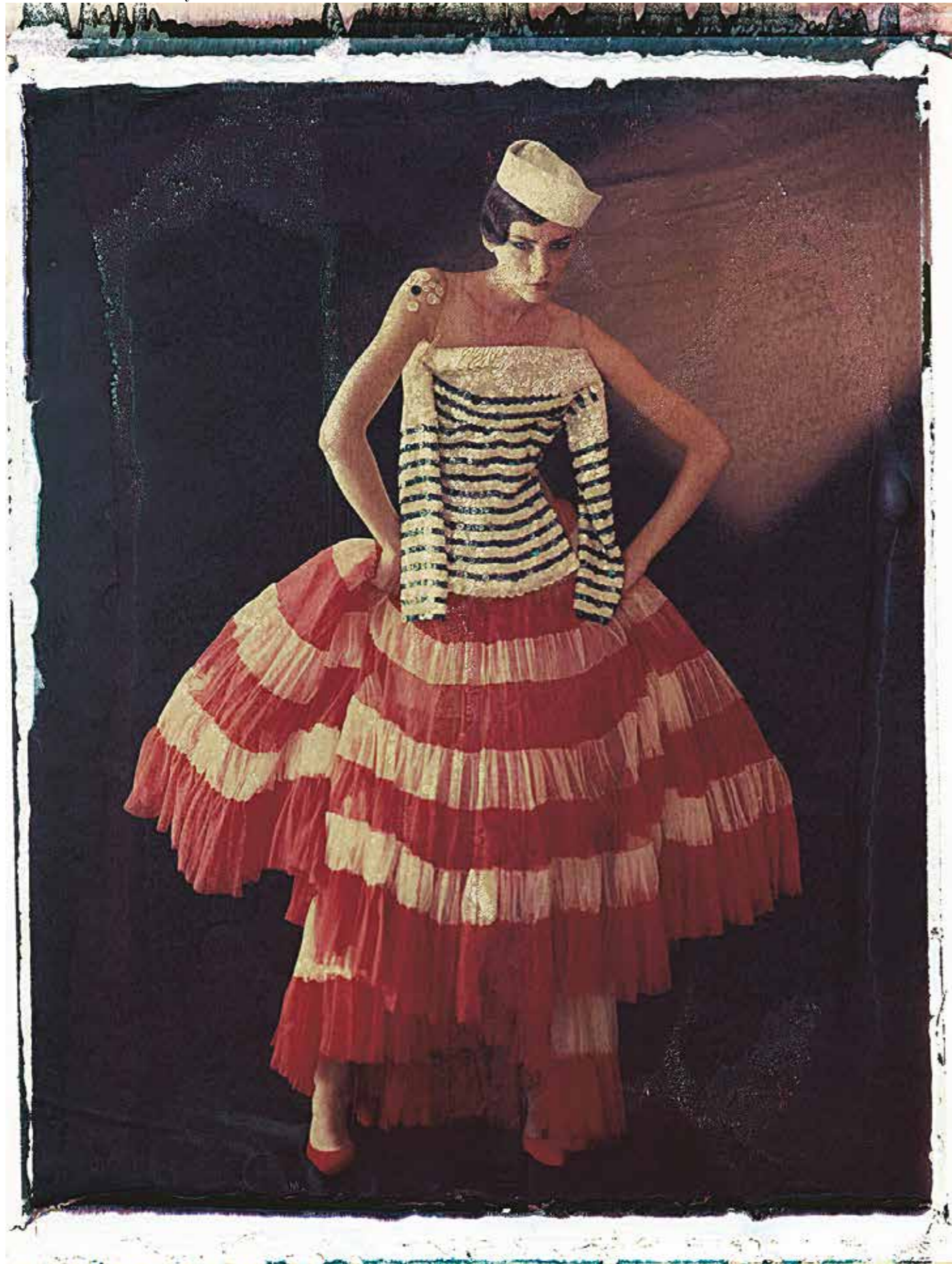
"L'enfant terrible" – Jean-Paul Gaultier – HC summer 2003 – Atelier d'artiste – rue Caulaincourt, Paris – Color-print from original polaroid – 25.07.2007